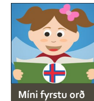
Míni fyrstu orð

Apps: "Míni fyrstu orð", "Telja" og "Ljóðbók"