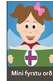
Míni fyrstu orð

Appirnar: "Míni fyrstu orð", "Telja" og "Ljóðbók"